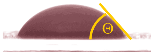
Kontaktwinkel 50 ° (Sessile-Drop Methode)